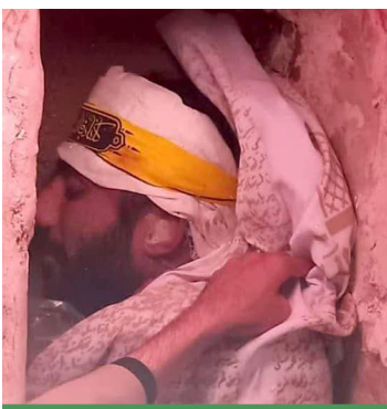
دفن پیکر پاک شهید در گلزار شهدای بیرم

اهل بی‌تفاوتی نسبت به جامعه نبود. به شدت با تنبلی و بطالت مبارزه می‌کرد. از خودگذشتگی و دلسوزی برای دیگران هم از خصلت‌های پسندیده ایشان است. ملاک دوستی‌اش با دیگران، جذب به مسجد و هیئت و کارهای جهادی بود. به همین خاطر تلاش می‌کرد در دوره‌های بازی‌های مختلفی را برگزار کند تا حتی از این فرصتها هم