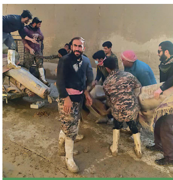
قالی‌شویی جهادی برای فرش‌های سیل‌زدگان