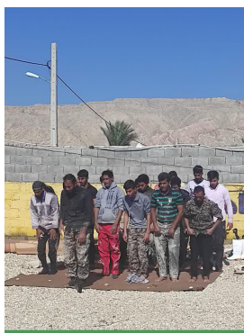
اقامه نماز در قالی‌شویی جهادی