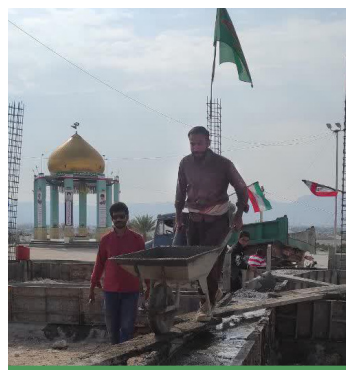
همکاری در ساخت سالن شهدای گمنام